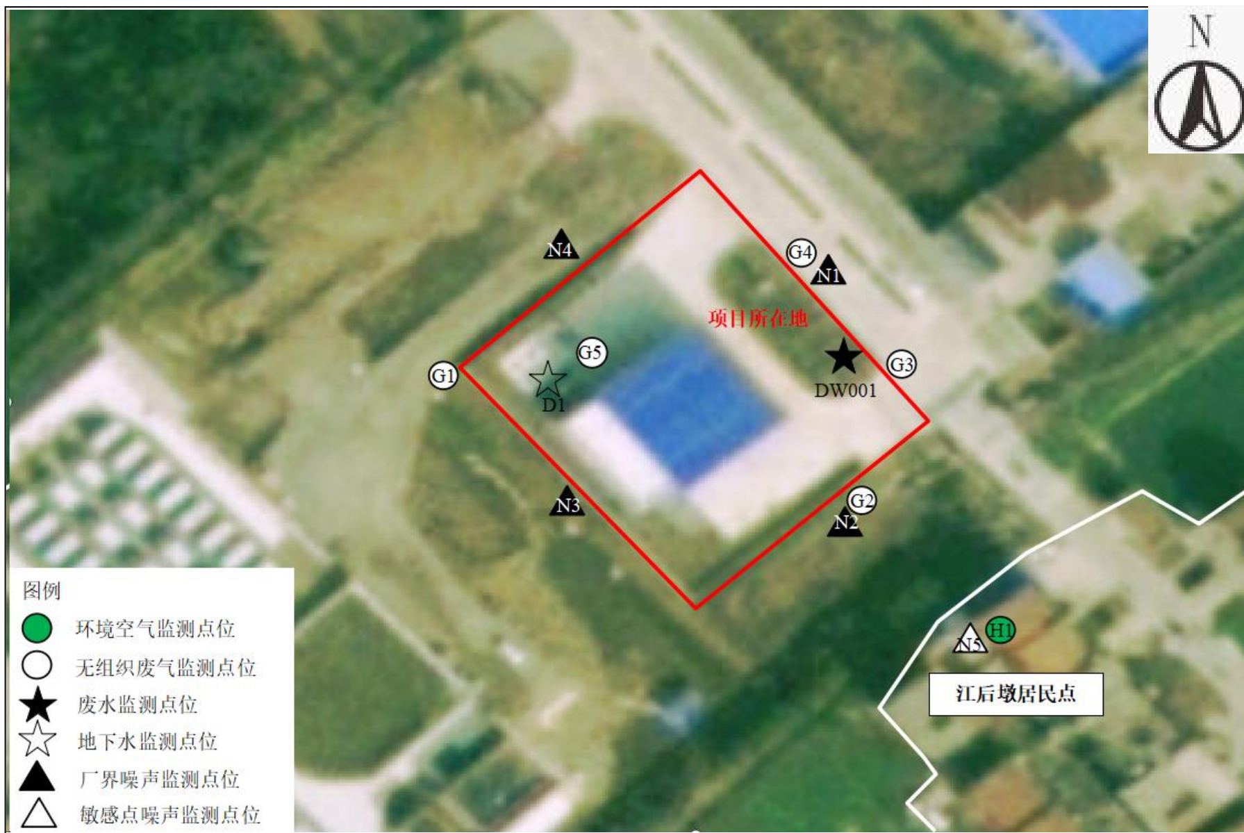
附图 4 项目监测点位图